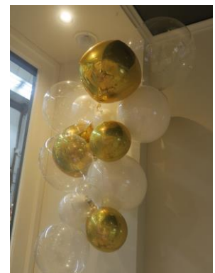
泡過ぎる バルーンアート